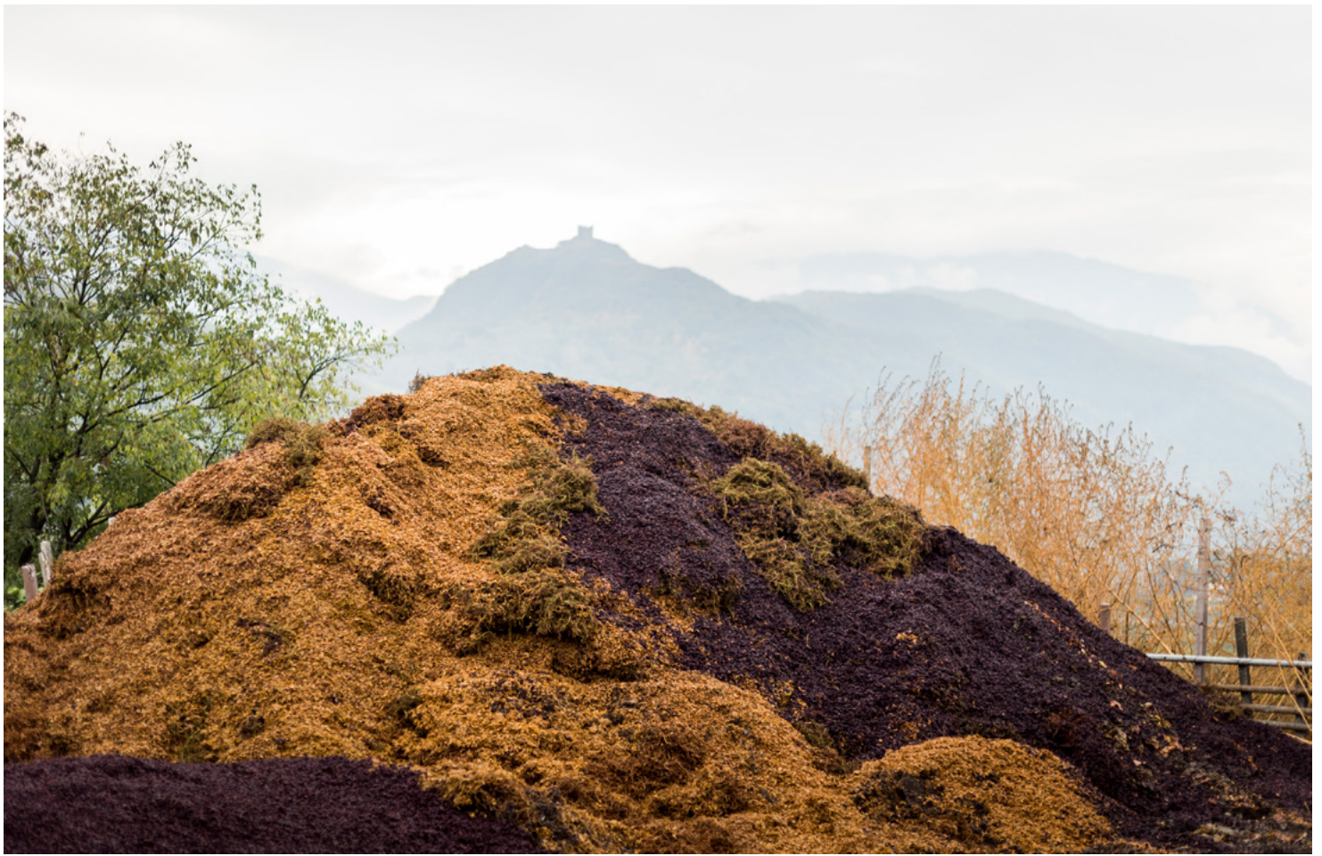
Trester und Rappen: Was bei der Weinproduktion übrig bleibt, dient als Basis für unseren eigenen Kompost. Vinacce e raspi: ciò che resta dopo la vinificazione diventa la base del nostro compost. Pomace and stems: what remains after winemaking becomes the foundation of our own compost.

Einige Tage zuvor spritzen wir zur Vorbereitung Brennnesseltee. Wir verwenden frisch gekochten, milden Tee. Ziel ist es, das Erwachen der Kräfte anzuregen, nicht allopathisch einzugreifen. Der Mondrhythmus ist dabei zentral: Wir wollen im Zusammenspiel der Kräfte arbeiten.